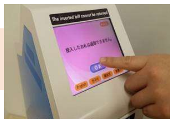
外貨が戻らないことを 確認しOKをタッチ