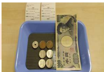
お客様控えに記載の 両替額を確認し日本円を渡す