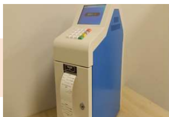
店舗控えとお客様控え 2枚のジャーナルが排出