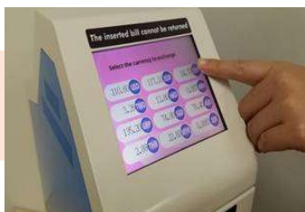
両替したい外貨を 選択してタッチ