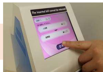
外貨と両替額に誤りがな ければOKをタッチ