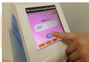
本日のレートを確認 してOKをタッチ