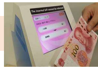
外貨を1枚ずつ挿入