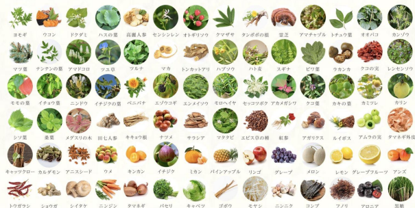
野草を中心とした83種類の原料