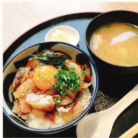
晴の海鮮ユッケ丼

1,500円（税込） 産地直送の旬の新鮮なお刺身をランチでお楽しみ頂けます。晴の人気定食です。